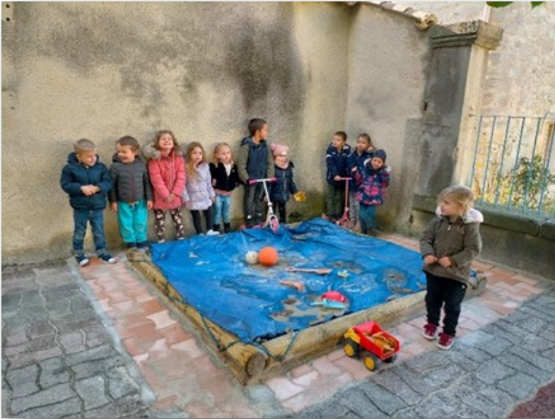
Bac à sable avec les écoliers.

La rentrée des classes a eu lieu le jeudi 1 er septembre.