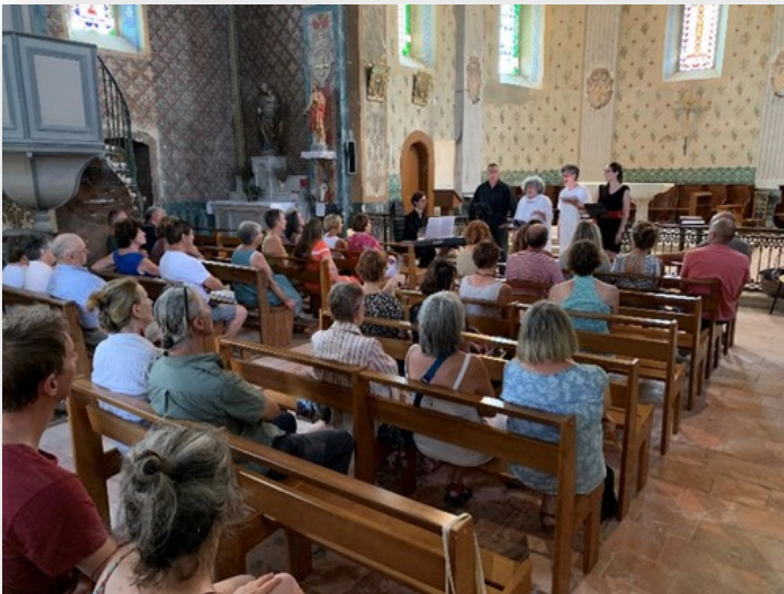
La Chorale du Delta dans l'église de Montjoyer.

Nous étions une soixantaine ce vendredi 5 août pour assister au concert de l'Ensemble Vocal Delta dirigé par Coline Serreau.