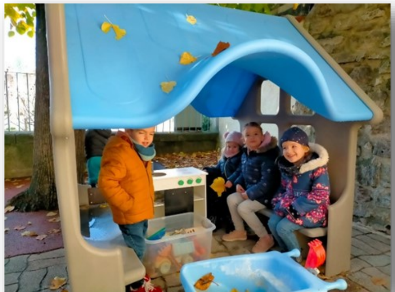
Maisonnette avec les écoliers.